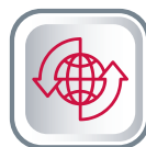
ИМПОРТОЗАМЕЩЕНИЕ В СФЕРЕ ЗАЩИТЫ ИНФОРМАЦИИ

Компания ARinteg — российский системный интегратор, с 1996 года предоставляет полный комплекс экспертно-аналитических, технических и консалтинговых услуг в сфере информационной безопасности и широкий спектр ИТ-сервисов на основе надежного программного обеспечения и оборудования, имеет собственные разработки.