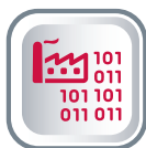
ЗАЩИТА ИНФОРМАЦИИ В АСУ ТП