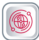
IT-ИНФРАСТРУКТУРА, РЕШЕНИЯ ДЛЯ ЗАЩИТЫ