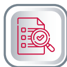
АУДИТ И КОНСАЛТИНГ